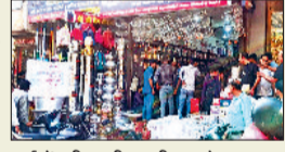
बर्तनों की खरीदारी करते ग्राहक।

सिरसा। धनतेरस पर्व को लेकर शनिवार को बाजारों में काफी रौनक रही। लोगों ने बर्तनों, सोने-चांदी के जेवर, दीपक, सजावट के सामान आदि की खरीदारी की। उधर सुरक्षा को लेकर पुलिस चाक चौबंद रही। शहर में जगह-जगह पर पुलिस बल तैनात रहा। धार्मिक मान्यताओं के अनुसार धनतेरस को स्वर्ण-चांदी आभूषणों के अलावा बर्तनों, दीपक, सजावट के सामान आदि की खरीदारी की। मान्यताओं के अनुसार आज के दिन गहने अथवा बर्तनों की खरीदारी किया जाना उत्तम माना गया है। वाहकों को आकर्षित करने के लिए दुकानदारों की ओर से विशेष तैयारियों की गई थी। दुकानों को विशेष रूप से सजाया गया था। त्यौहार के दृष्टिगत नए-नए डिजाइन की वस्तुएं डिस्प्ले की गई थीं ताकि वाहकों का ध्यान बरबस ही अपनी ओर आकर्षित किया जा सके। सुबह से ही बाजारों में काफी गहना गहमी रही, जिसकी वजह से बाजारों में सारा दिन रौनक रही। बर्तनों की दुकानों पर तो महिलाओं ने धार्मिक मान्यता अनुसार खरीदारी की, वहीं लोगों ने आभूषणों की भी खरीदारी की। इसके अलावा गिफ्ट शॉप, रेडीमेड वारमेंट, ड्राई फ्रूट, दीये आदि की भी खरीदारी हुई। दुकानों पर वाहकों की आवाजाही बढ़ गई है और बर्तनों की खनक से बाजार गुलजार है।