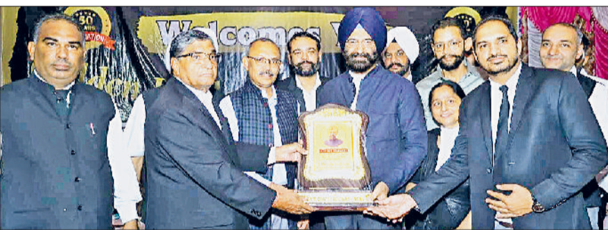
सिरसा। कैबिनेट मंत्री मनजिंदर सिंह सिरसा को सम्मानित करते हुए बार एसोसिएशन।

बार एसोसिएशन के गोल्डन जुबली पर पहुंचे कैबिनेट मंत्री मनजिंदर सिंह सिरसा