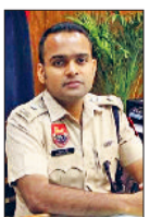
पुलिस प्रशासन द्वारा कहा कि किसी भी वीडियो या फैंसी मोबाइल नंबर की ऑनलाइन खरीद से पहले उसकी प्रामाणिकता की अच्छी तरह से जांच-पड़ताल करें। अज्ञात खातों या व्यक्तियों को कोई भी धनराशि ट्रांसफर न करें, चाहे प्रस्ताव कितना भी आकर्षक क्यों न हो। सिम कार्ड केवल अधिकृत मोबाइल सेवा प्रदाताओं की वेबसाइट या प्रमाणित स्टोर से ही खरीदें। यदि कोई व्यक्तिगत जानकारी या दस्तावेज मांगे, तो सतर्क रहें और सोच-समझकर प्रतिक्रिया दें। किसी भी प्रकार की ऑनलाइन टगी की सूचना तत्काल साइबर हेल्पलाइन नंबर 1930 या नजदीकी पुलिस थाना में दें। जैन ने स्पष्ट किया कि जनता की सतर्कता ही उसकी सबसे बड़ी सुरक्षा है। बिना जांच-पड़क के क्लिक न करें, लालच या जल्दबाजी आपको साइबर टगी का शिकार बना सकते हैं।