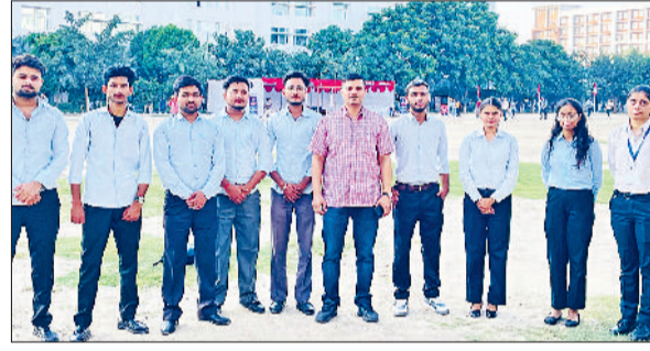
सिरसा। प्लेसमेंट ड्राइव में भाग लेने से पूर्व इंजीनियरिंग के छात्र।

चौधरी देवी लाल राज्य अभियंत्रिकी एवं प्रौद्योगिकी संस्थान पन्नीवाला मोटा के छात्रों ने एक बार फिर संस्थान का नाम रोशन किया है। संस्थान के चार छात्रों का चयन देश की प्रतिष्ठित ऑटोमोबाइल कंपनी में हुआ है। यह चयन चंडीगढ़ विश्वविद्यालय में आयोजित संयुक्त प्लेसमेंट ड्राइव के दौरान किया गया। यह प्लेसमेंट ड्राइव 14 अक्टूबर को प्रारंभ हुई, जिसमें विभिन्न इंजीनियरिंग कॉलेजों के छात्रों ने भाग लिया। चयन प्रक्रिया में ऑनलाइन एप्टीट्यूड टेस्ट, तकनीकी साक्षात्कार एवं एचआर इंटरव्यू जैसे कई चरणों के बाद इन चार विद्यार्थियों का चयन किया गया।