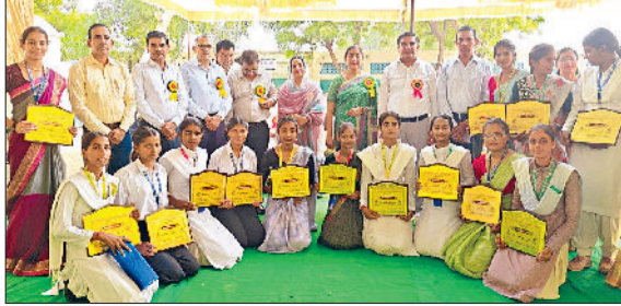
सिरसा। छात्राओं को सम्मानित करते हुए डीईओ।