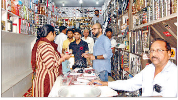
फतेहाबाद । बर्तन की दुकान पर खरीदारी करती महिलाएं व ज्वेलर्स पर खरीदारी करते लोग।