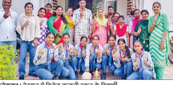
फतेहाबाद। नेटबाल में विजेता बालाजी स्कूल के विद्यार्थी