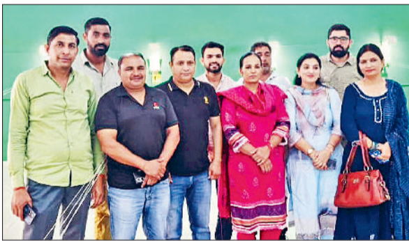
सिरसा। शूटिंग प्रतियोगिता के शुभारंभ पर मुख्यातिथि व अन्य।