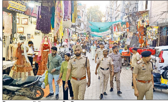
सिरसा। बाजारों में गश्त करती पुलिस।

त्योहारों की आड़ में किसी भी प्रकार की गड़बड़ी करने वालों को बख्शा नहीं जाएगा : एसपी